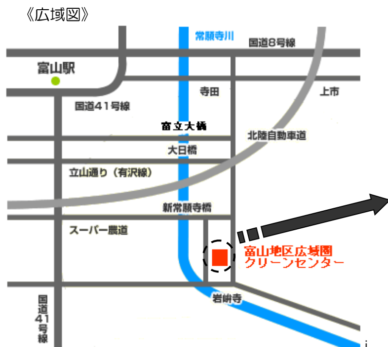
富山地区広域圏事務組合 周辺図